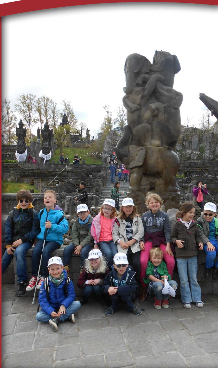
Een groep kinderen zit op een muurtje. Sommigen dragen een witte pet. Achter hen is een standbeeld van een groep olifanten. Rechts zien we het gebogen dak van een pagode.

Steven Bladt, een vindin- grijk man met vele projecten.