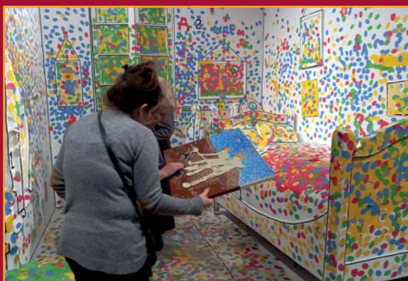
Tentoonstelling 'Van Gogh au Borinage' van BAM, aangepast voor een blind publiek

De 5 nieuwe musea die werden geopend in het kader van Bergen 2015, Culturele Hoofdstad van Europa, zijn: Le Musée du Doudou, de neolithische silexmijnen van Spiennes, het Mons Memorial Museum, de Artothèque en binnenkort ook het Belportmuseum.